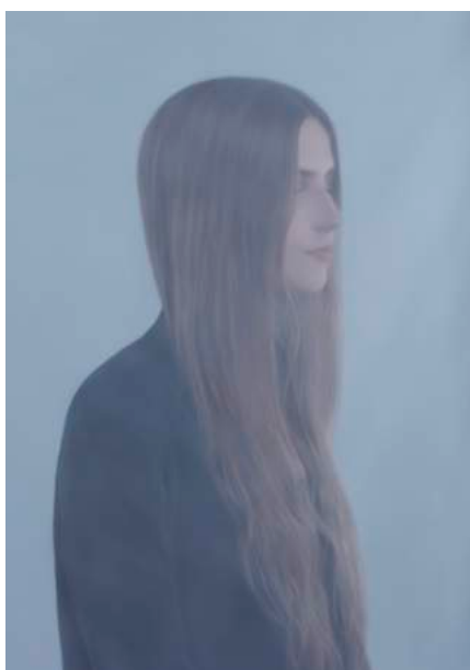
Margherita © Charlotte Mano