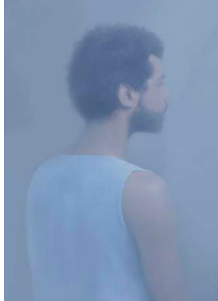
Guillaume © Charlotte Mano