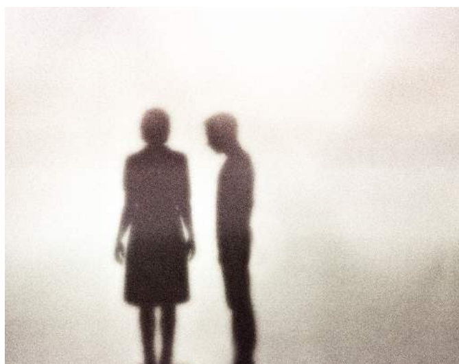
A l'infini nous rassembler