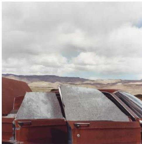
On the edge – Nevada