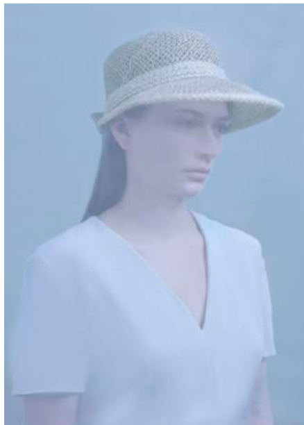
Maeliss © Charlotte Mano