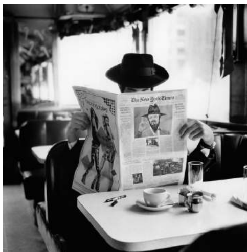
Brooklyn - New York Times © Sacha Goldberger