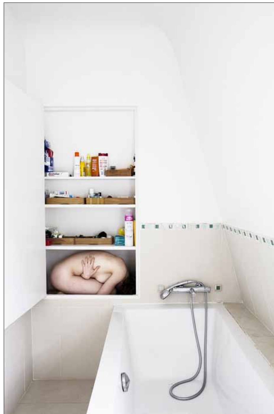
Série L'élément du décor

Lauréate du Grand Prix Paris Match Photo Reportage Étudiant 2016, Prix spécial du Jury, Clémence Losfeld est membre du studio Hans Lucas depuis octobre 2016.