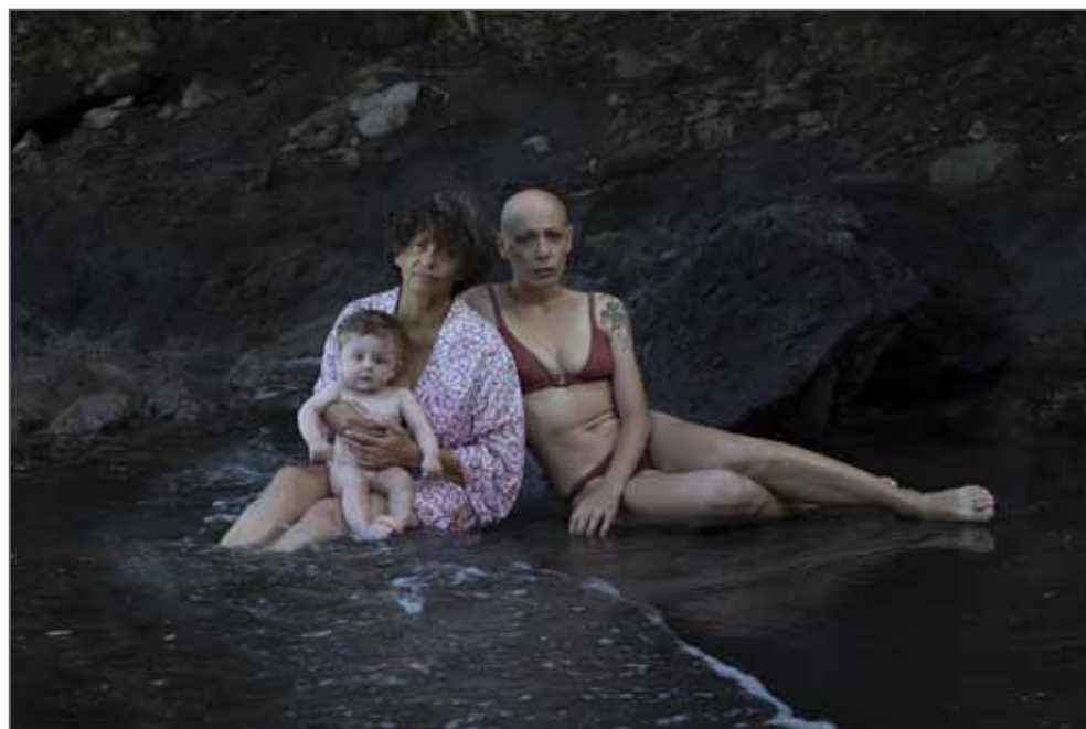
Série Case Pilote