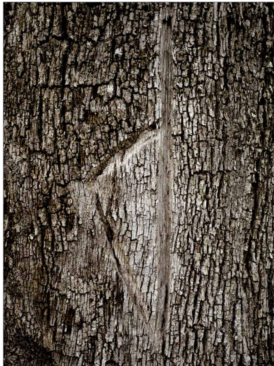
Une Corse stylisée gravée dans un chêne liège sur la route de Conca, 2018. De la série Qui, ancu i muntagni si scontrani