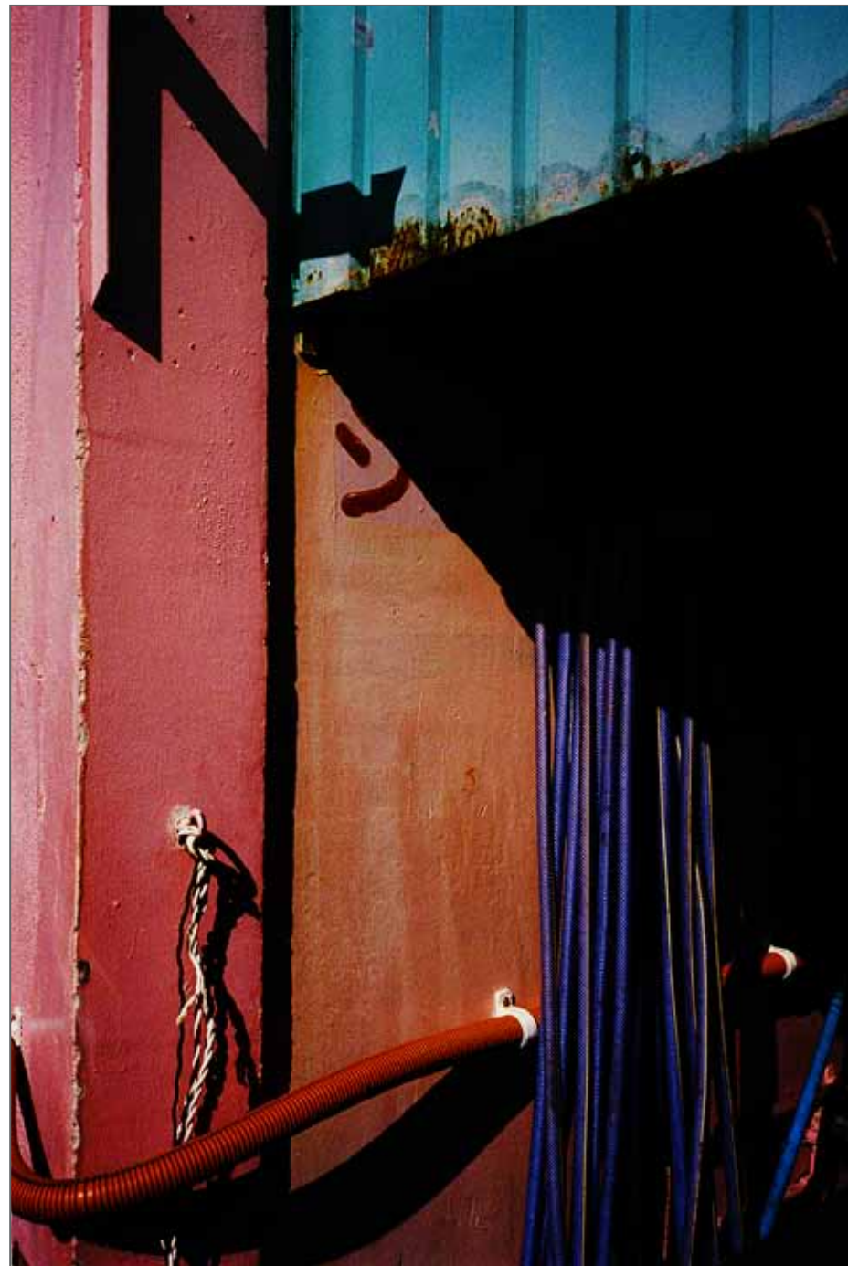
Série Black is burned

En 2018 est publié 8 , son second livre chez Poursuite, puis Red Harvest chez le même éditeur. Elle collabore avec des magazines et des journaux français et internationaux en tant que reporter photo et photographe de portrait ainsi qu'en tant que photographe de mode pour plusieurs marques. Elle est représentée par la galerie française Made et la galerie portugaise Carlos Carvalho ainsi que par des agences en France et en Angleterre.