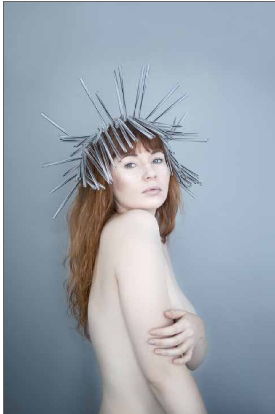
Série Re-cycle © Marion Saupin