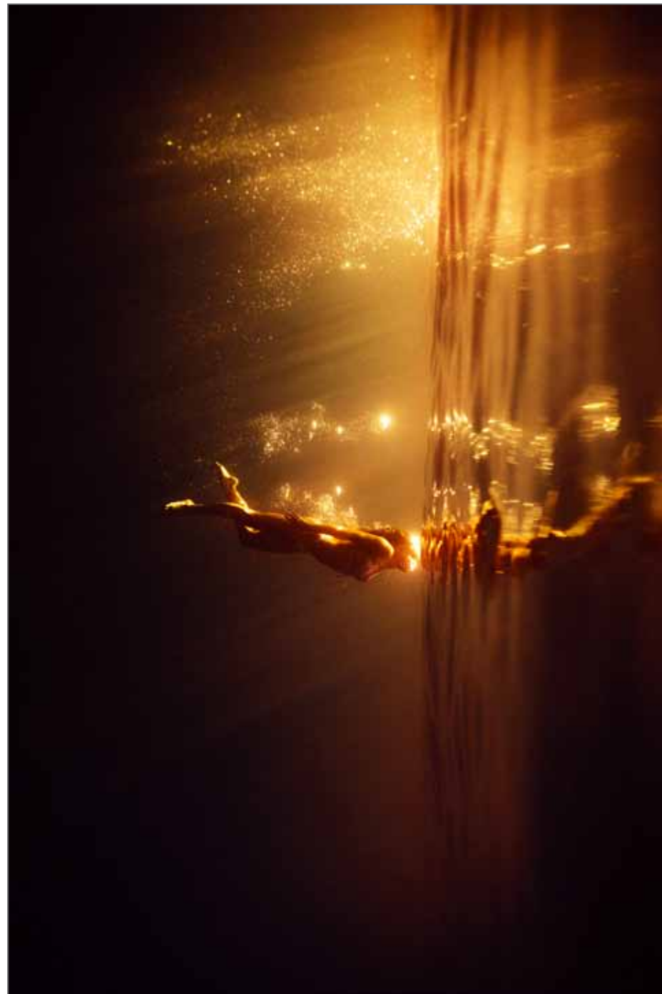
Série The wall © Arnaud Moro