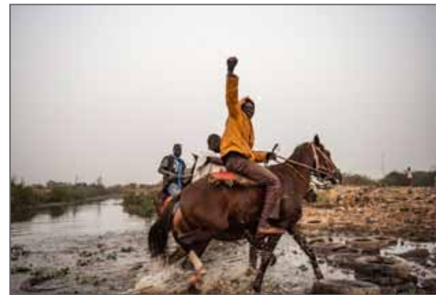
Série Les cowboys sont toujours noirs