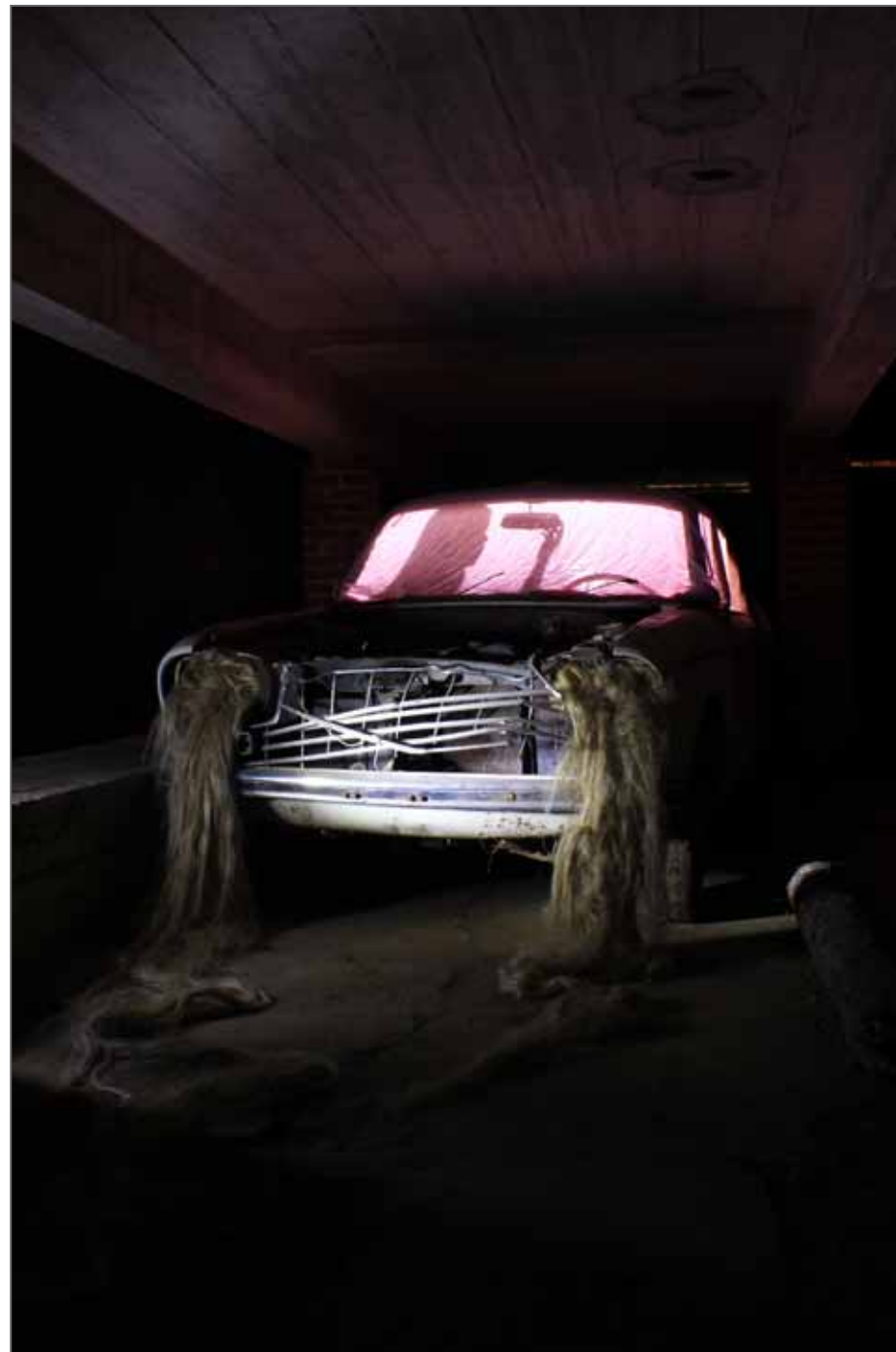
Parlez moi d'amour

Née en 1994 en Normandie, après l'obtention d'un Bac Littéraire option Arts Plastiques en 2012, j'ai intégré l'École des Beaux-Arts de Rouen. C'est au sein de ce cursus que mon intérêt pour le médium photographique s'est manifesté. Cet établissement m'a permis de développer une réflexion artistique et de trouver mon propre univers. En 2017, j'ai obtenu mon DNSEP (Diplôme National Supérieur d'Expression Plastique) avec les félicitations du jury. Ce master m'a apporté un bon bagage artistique, mais j'étais soucieuse de mon manque de connaissance dans le domaine technique de la Photographie, j'ai donc décidé de continuer mon parcours scolaire. Après avoir passé le concours, cette année j'ai eu la chance et le plaisir d'intégrer la section Photographie de l'École de l'Image des Gobelins.