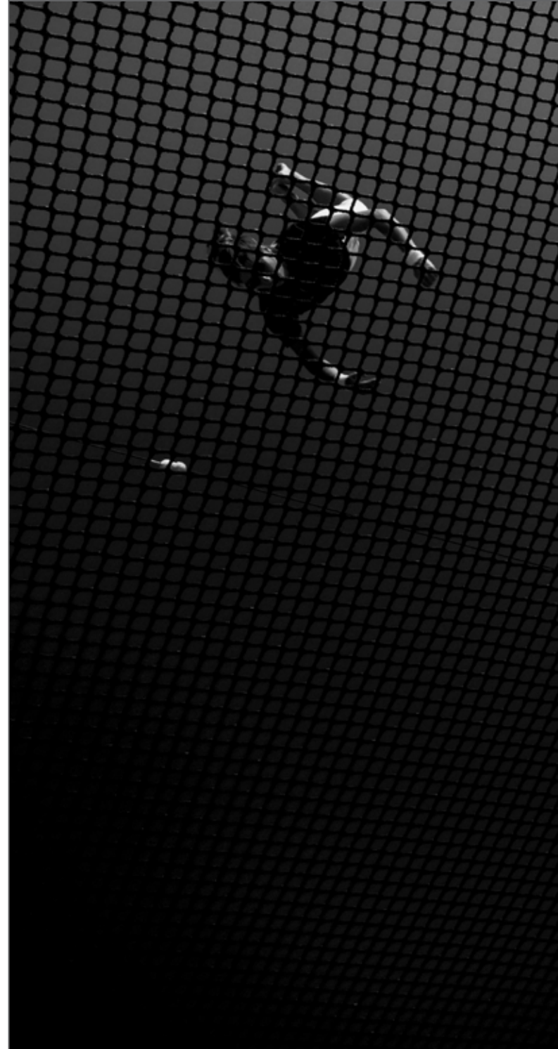
série Oiseaux de Nuit

Et puis, un jour, c'est une évidence : il abandonne son travail pour se consacrer uniquement à la photographie. Jacques Maton est aujourd'hui photographe indépendant, son travail s'inscrit dans une démarche documentaire à la frontière entre journalisme et photographie d'art, avec une attention accordée aux minorités. Parallèlement à ses travaux personnels, il répond à des commandes (portrait, événementiel, reportage) principalement pour des maisons d'édition, des agences de communication, des magazines, des artistes, des associations. Au-delà de la narration, il privilégie une approche intimiste, se laissant surtout guider par la poésie de l'instant. Univers aquatique ou monde végétal, paysages ou enfants d'un orphelinat de Saïgon, coulisses de défilés ou intimité des gens du voyage. Son travail photographique nous révèle la dimension sensuelle et humaine des sujets qu'il aborde.